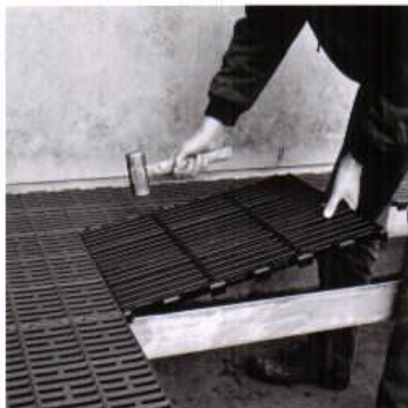
Billede 4 Ved stier med hævet støbejern monteres først alle plastkomponenterne i stien, se i øvrigt billede 8. Ved stier med støbejern og plastriste i samme niveau monteres støbejernsristene samtidigt med plastristene. Dog skal der tages hensyn til åbning for montage af varmerørledninger.