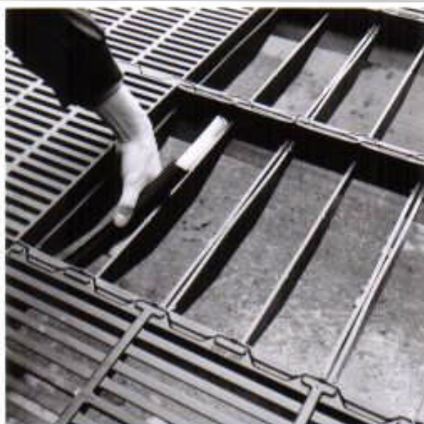
Billede 5 PEX-rørledningen føres frem til rammeelementerne, hvor varmepladen skal monteres.