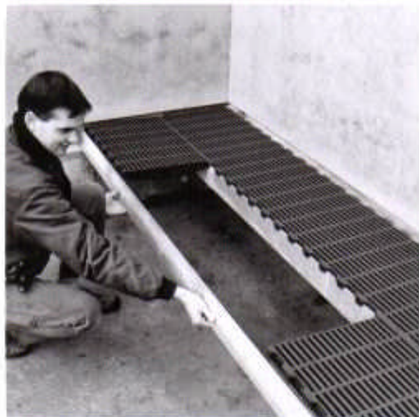
Billede 3 Fladjemene monteres lettest efter, at en del af ristene er sat sammen med den færdige række.

Faresti med flad plast-/støbejernsrist eller hævet parallel støbejernsrist